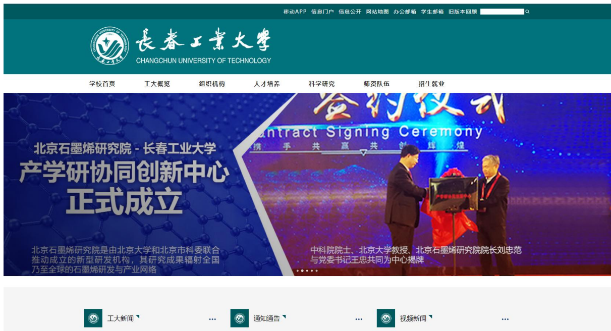
图 1：长春工业大学校园主页

学校信息公开网包括信息公开目录、信息公开指南、规章制度、依申请公开、受理与监督等多个栏目。通过网站内容和相关链接，学校师生和社会公众可以对学校信息公开的制度及内容进行查阅。构建了以校园主页为基础，工大新闻网为主要载体，结合微信、微博等新媒体全新综合信息发布渠道，推动信息公开工作深入开展。