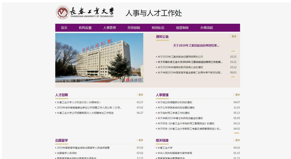
图 6: 人事师资信息公开情况

和兼职管理办法（暂行）》。保证了学校教学科研、人才培养等中心工作的有序进行。学校定期发布《吉林省省直事业单位公开招聘工作人员公告》和《吉林省事业单位专业技术二级和三级岗位管理试行办法》，致力于招聘和培养高层次创新型人才，提升学科建设水平。公开招聘人员公示情况也在人事部门网站予以公开。