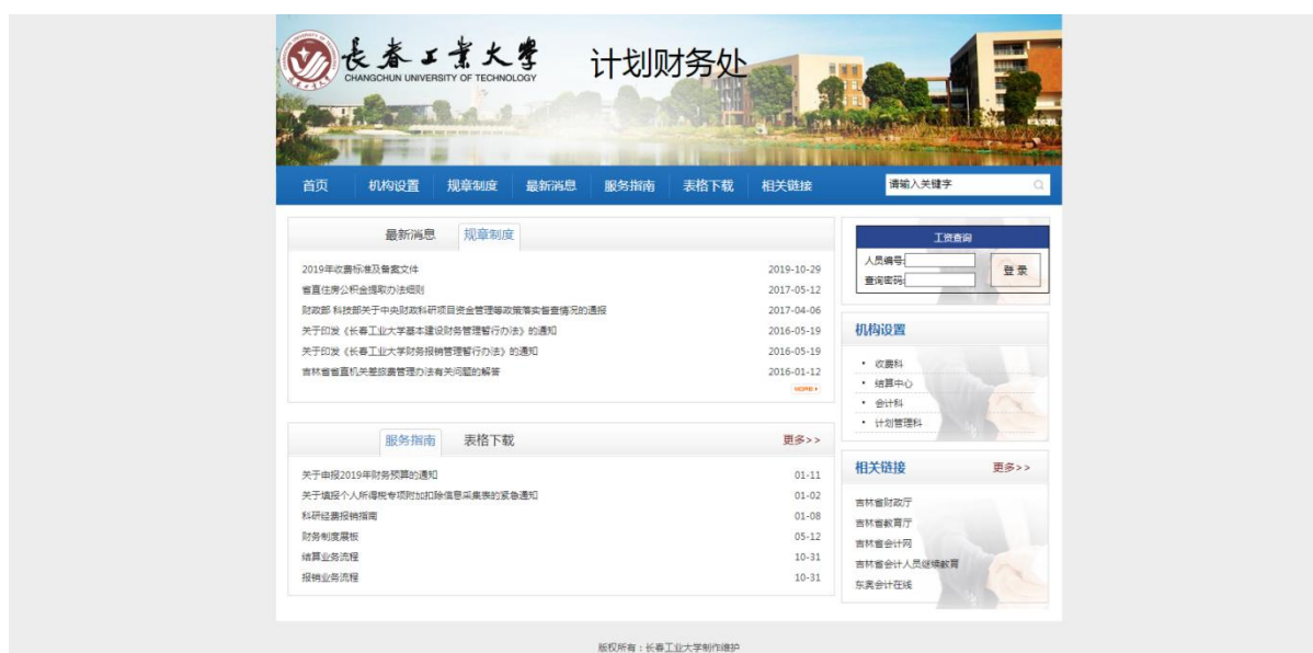
图 5：年度预算公开情况

财务及收费信息公开。财务管理制度，学校教育收费的项目、依据、标准等均在财务处网页予以公开。学校编制预算过程中，及时公布预算内容安排和分配原则，积极进行沟通，预算方案提交校党委常委会审议批准执行。在每年教代会上，审议财务运行状况和各单位预算执行情况。在预算、决算批复后 10 个工作日内，通过学校信息公开网及时主动地向社会主动公开高等学校收支预算总表、高等学校收入预算表、高等学校支出预算表、高等学校财政拨款支出预算表、高等学校收支决算总表、高等学校收入决算表、高等学校支出决算表、高等学校财政拨款支出决算表等财务信息。