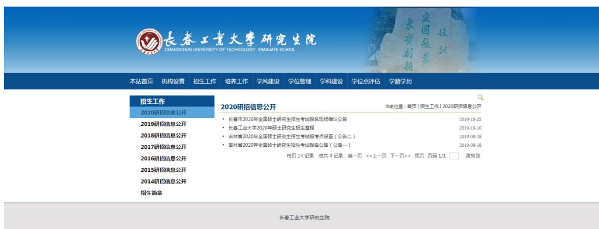
图 4: 研究生招生信息公开情况

在招生过程中，严格贯彻落实“阳光工程”关于招生信息“十公开”政策要求，加强全过程、全方位信息公开。通过媒体报导、网站、微信等多种途径向考生及家长宣传学校招生信息；向全国各省市累计 6500 所中学寄发《长春工业大学招生指南》；通过教育部阳光高考平台以及学校本专科招生网站及时、准确的向考生公布及提供查询有关录取政策、录取状态、录取结果等信息。做好艺术类专业录取考生的咨询、考试及公示工作。招生录取期间开通招生咨询电话，热情全面地为广大考生及家长提供招生咨询，介绍分省、分专业招生计划以及学生管理、教学、收费、奖励等详细情况。