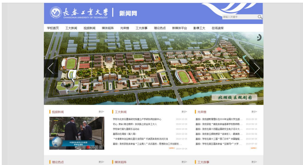
图 2：长春工业大学新闻网