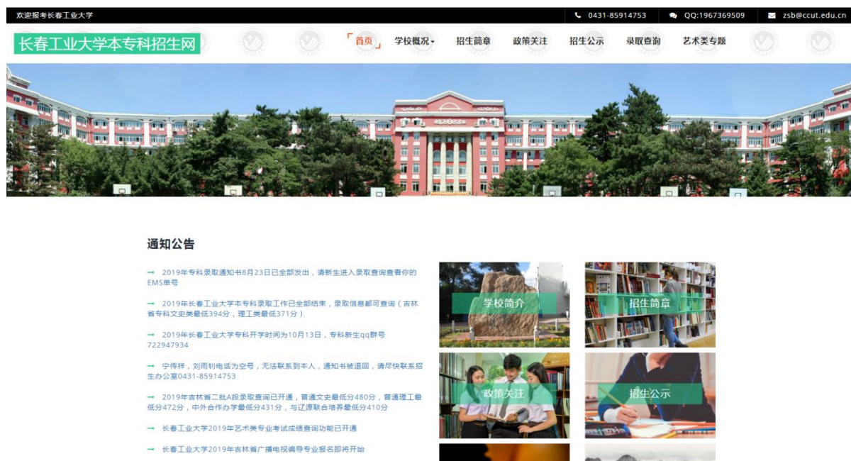
图 3: 本专科招生网

学校简介，校领导班子简介及分工，学校机构设置，学校章程及制定的各项规章制度，教职工代表大会相关制度、工作报告，学术委员会相关制度、年度报告，学校发展规划、年度工作计划及重点工作安排，信息公开年度报告在信息公开网基本信息栏目对外公开。